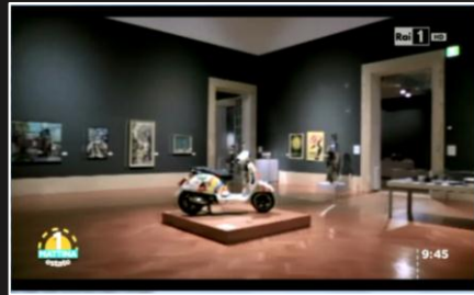
Rai 1 – Uno Mattina