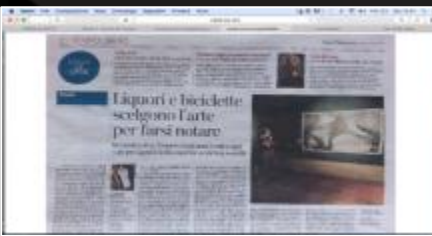
Corriere della Sera