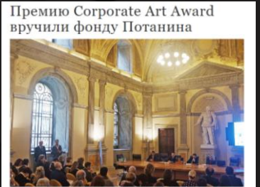
Премия Corporate Art Award вручили фонду Потанина